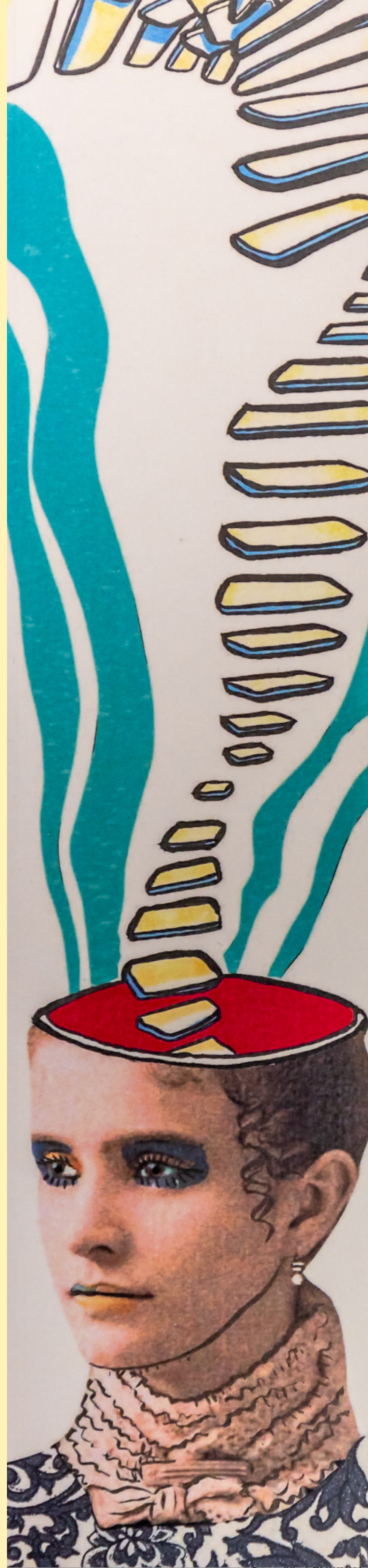
ILUSTRACIÓN: MARTA RUÍZ ARTOLA

ENTRADA LIBRE / Plataforma ZOOM se facilitará enlace en https://aen.es/